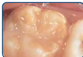
Kaaskies in het blijvend gebit