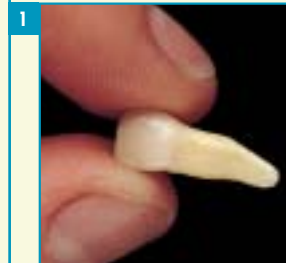
1 Zoek de tand en pak deze bij de KROON en liever niet bij de wortel.