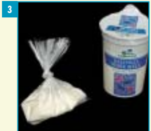
3 Stop de tand terug in de KAAK . Durf je dat niet, bewaar hem dan vochtig in een bekertje of zakje melk. Laat de tand vooral niet droog worden. Ga onmiddellijk naar een TANDARTS . De tandarts zal de tand meestal terugplaatsen en vastzetten.