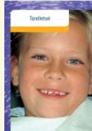
Deze folder bevat informatie over tandletsel. Vraag hem bij uw tandarts of mondhygiënist.