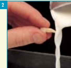
2 Het schoonmaken van een uit de mond geraakte tand kan door aflikken of door onderdompeling in melk. Afspoelen met melk kan ook. Er mag geen water bijkomen.