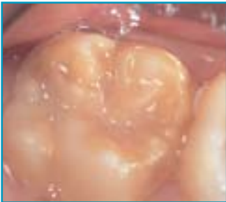
Een kaaskies in een blijvend gebit