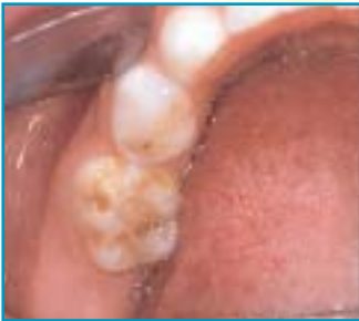
Een kaaskies in een melkgebit